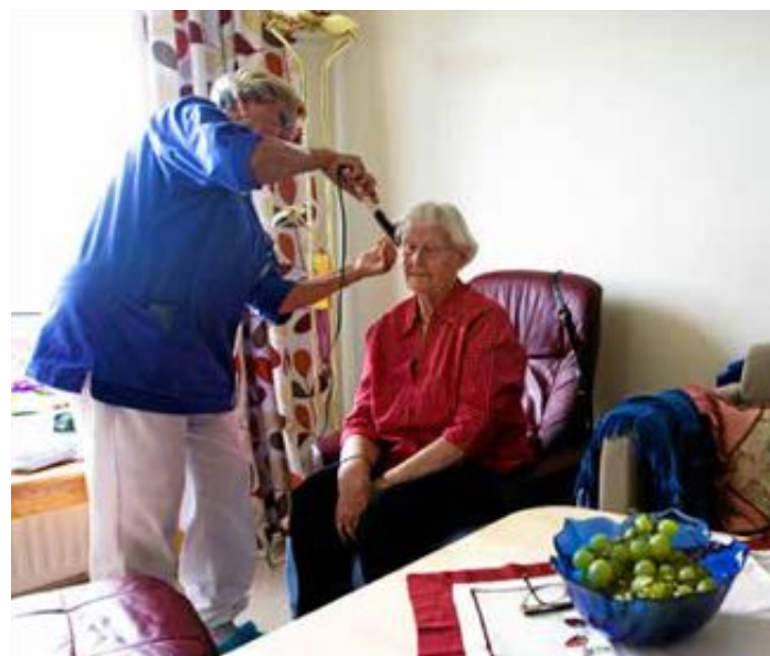
Private: Det bør flere private aktører på banen, også i tunge offentlige sektorer, skriver innleggsforfatterne.