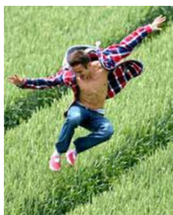
Framtiden: Det er nødvendig med kompetansekrav i landbruket, mener NBU.

Norges Bygdeungdomslag ønsker derfor et kompetansekrav i landbruket. Det vil øke omdømmet og attraktiviteten til næringa. Bønder som tar i bruk kunnskap om god agronomi og dyrevelferd vil ha større mulig-