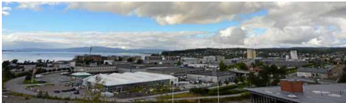
Her? Landbruksdirektoratet kan havne i Steinkjer, om trønderfylkene får det som de ønsker.