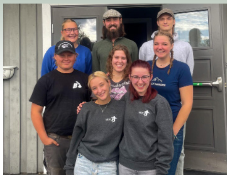
Det nye styret til Ås