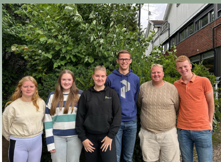
Det nye styret i Gjerdrum