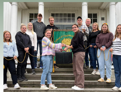
Det nye styret til Sørumsund