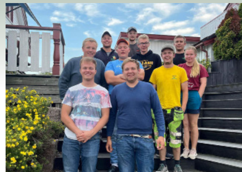
Det nye styret til Eidsvoll