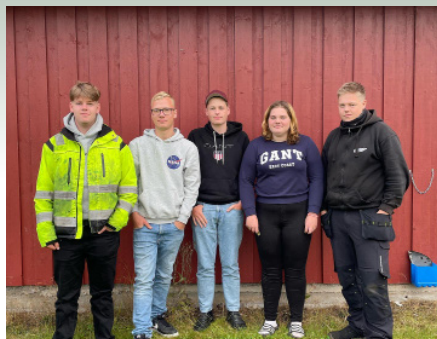
Det nye styret til Hurdal