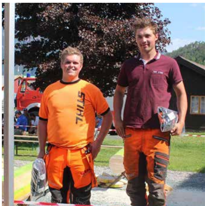
Stihl Cup, junior.