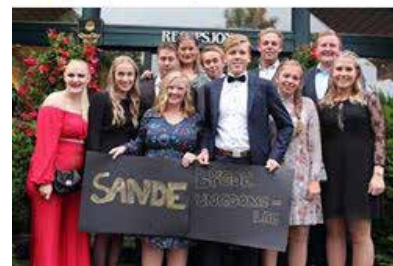
sande_bu · Følg Quality Straand Hotel, Vrådal