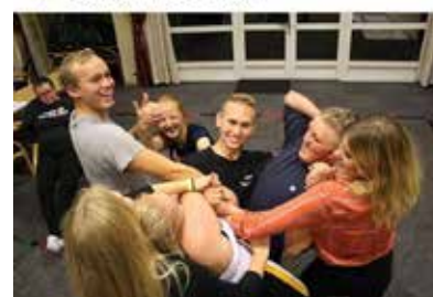
vestfoldbu · Følger Quality Straand Hotel, Vrådal