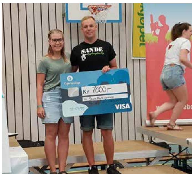
Årsmøte lokallag fra vestfold stakk av med seieren.

Tirsdag var det igjen duket for møtedag med mye spennende saker på agendaen. Denne dagen var det også hilsningstaler, vedtektsendringer og ikke minst skulle det deles ut noen priser til noen lokallag som hadde utviklet seg særlig det siste året. Denne prisen gikk til et lokallag som hadde gjennomført en rekke varierte aktiviteter, bidratt med dugnadsarbeid, samarbeidet med bondelaget og bygdekvinnelaget og vist stor grad av engasjement. Denne prisen gikk til et lokallag ifra Vestfold, og her var det Sande Bu som stakk av med seieren med i underkant av 30 arrangementer det siste året! Vel fortjent!