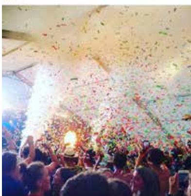
kathrinee95 · Følger