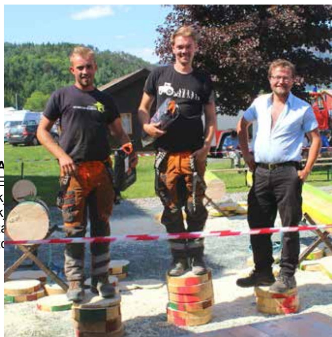
Stihl Cup, senior.