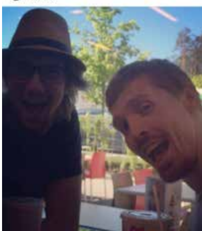
merry2208 · Følg Vestfold