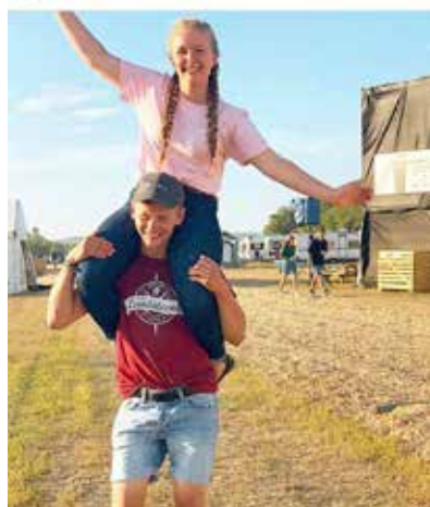
idakristinemyh · Følger