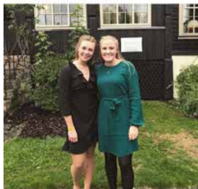
marenandvik · Følger Quality Straand Hotel, Vrådal