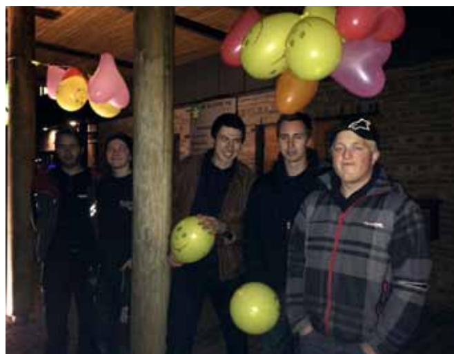
Re BU har pyntet opp utenfor kommunehuset.

Styret i Lågendalen hadde lenge begeistret seg over bingovorset som ble holdt en av kveldene under landsstevnet i 2013. Og siden 2014 var året kulturprosjektet «Gammal moro blir som ny» holdt på, måtte vi selv-