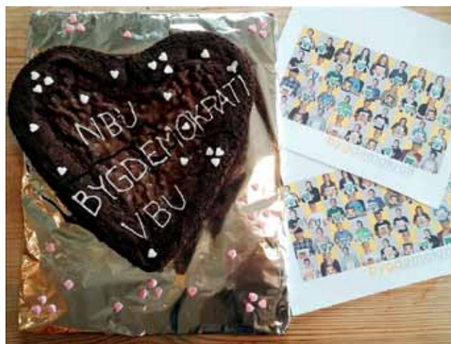
Stokke og Andebu har tatt med hjertekake og bilder av våre engasjerte medlemmer.