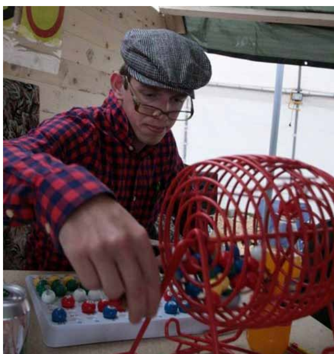
Gamle tradisjoner i sving.