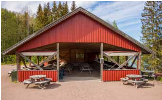
I Stolpehuset vil frokost, de fleste tevlinger og konserten foregå.