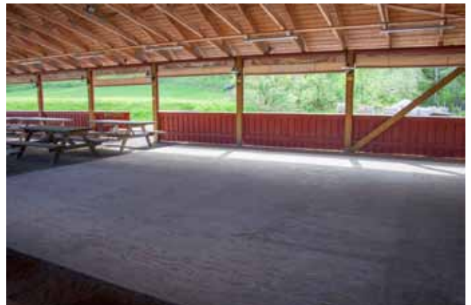
Dansegulv for å svinge seg litt.