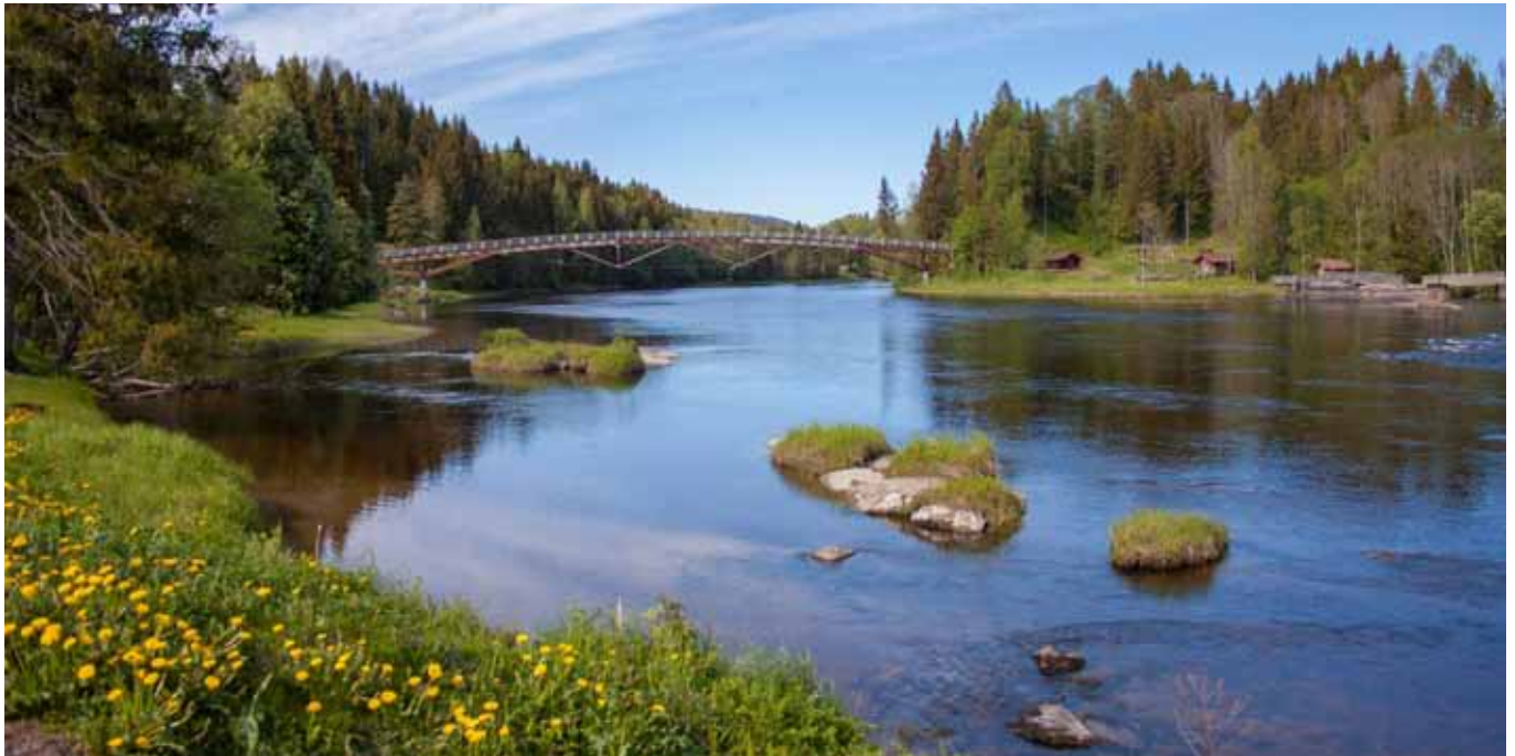
Flott utsikt fra stevneplassen.