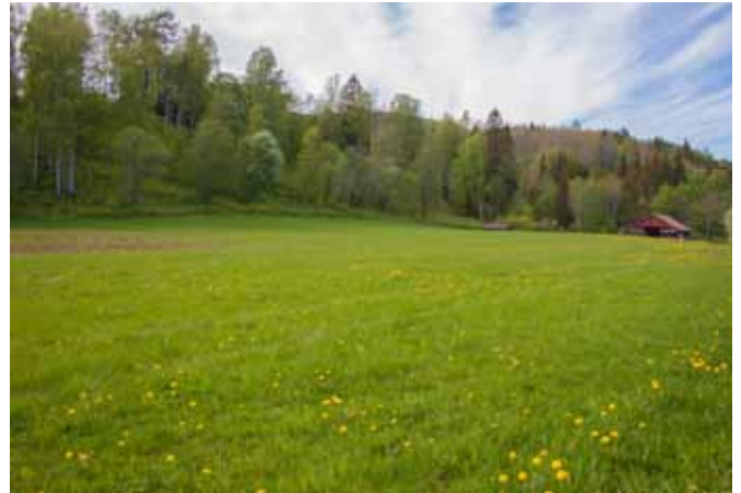
Her blir stevneplassen.

Vi i Lågendalen BU gleder oss masse til å arrangere sommerstevne for første gang, og tror dette vil bli en fantastisk helg med flotte bygdeungdom og mye moro!